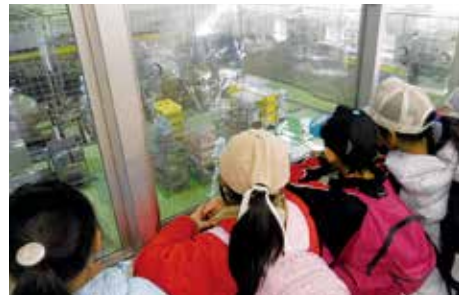
給食センター 見学の様子

中でも子どもたちの 人気メニューは、揚げ パンやハンバーグ、カ レー！笑顔ではおぼろ 姿を見ると、癒されま すね。 食の学習や学校給食 が家庭へとつながり、 全ての子どもが心も体 も健康で、健やかな生 活が送れるよう、これ からも食育に取り組ん でいきます。 問い合わせ 学校給食課 (567-2279 FAX 567-2329) X 567-2329