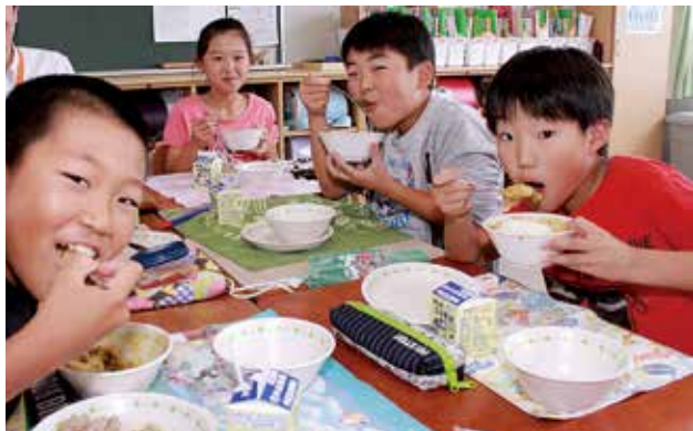
▲ 大好きなカレー！おかわりしたよ(三田小学校)