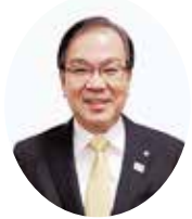
三田市長 森 哲男