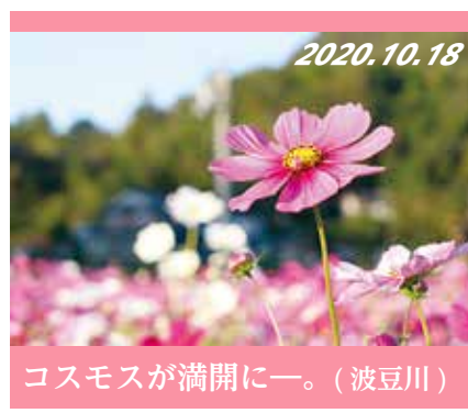
コスモスが満開に一。(波豆川)

児童虐待に関する相談対応件数は増加傾向で、命が奪われる重大な事件も後を絶たないなど、深刻な状況が続いています。子どもの命は社会全体で守らなければなりません。4月には、「親権者等は児童のしつけに際して体罰を加えてはならないこと」が法定化されました。児童虐待を受けたと思われる子どもを見つけたときには、「間違いかも・・・」などとためらわずにご連絡ください。皆さんからの連絡が、子どもを虐待から守るための大きな一歩となります。 児童相談所全国共通3桁ダイヤル189 (通話無料) 問 子ども家庭課(559-5072 F 563-3611)