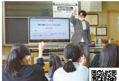
活動の詳細と一緒に挑戦したい人はInstagramへ!