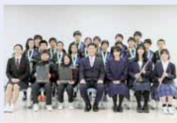
3月17日 スポーツ・文化の全国大会などで優秀な成績を収めた若者が来訪。さらなる活躍を期待し激励