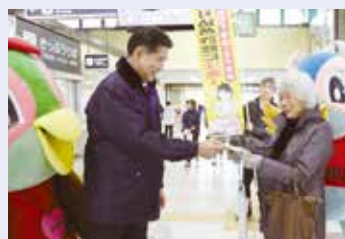
3月19日 特殊詐欺防止の街頭啓発を実施。三田警察や防犯協会と共に、三田駅前