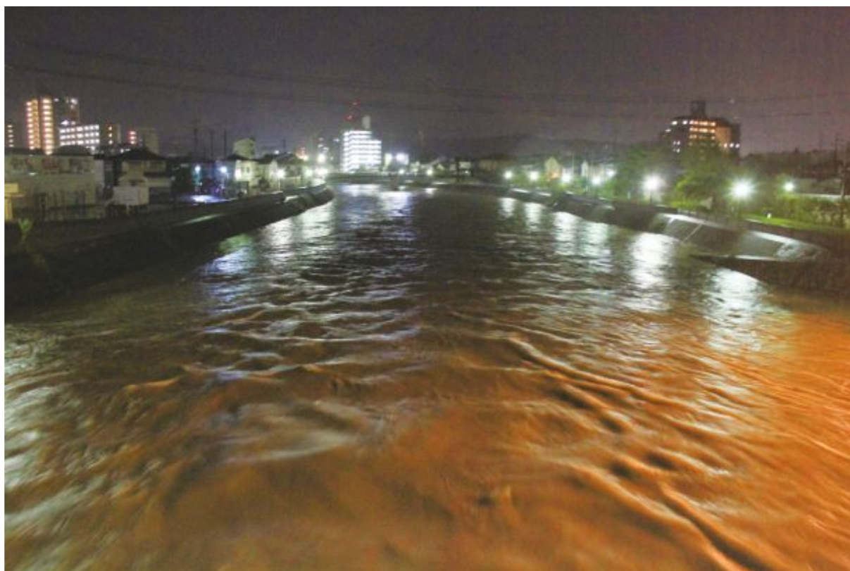
平成30年 7月豪雨 武庫川の状況（最高水位 5.00m）

市民の皆さまにおかれましても出水期を迎えるにあたり食料の備蓄、避難する際の心構え、自宅から避難所までの経路の確認など、いざという時の対応を家族で話し合うことをお願いします。