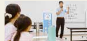
(市長による特別講義「お金の教育」の様子)