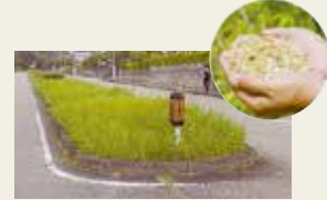
(北摂三田高等学校前の中央分離帯/実施前)