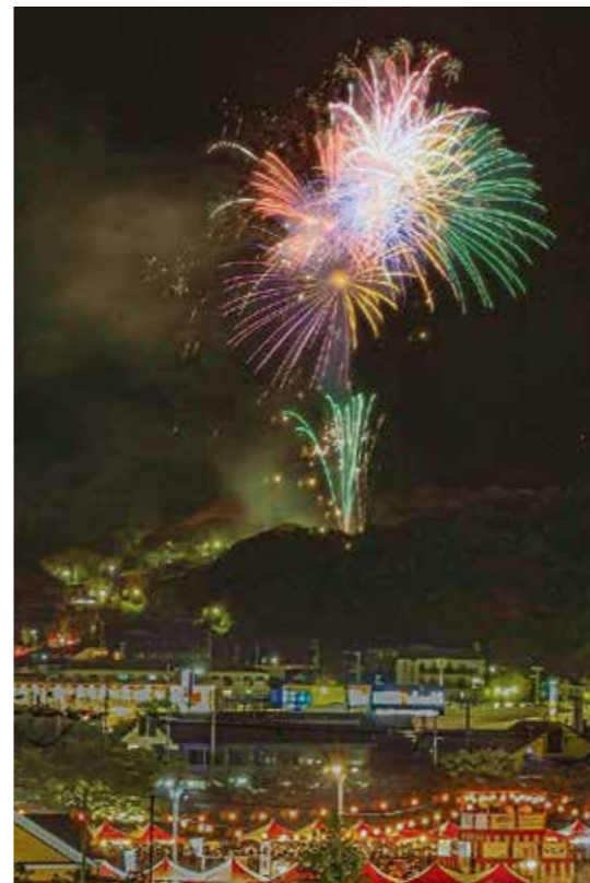
三田市消防本部付近 = 下深田 =

人混みと電線や電柱を避けるために、この場所を選びました。打ち上げ場所から1km程離れていたため花火全体を画角に入れる事ができました。虫と、暗いので足元に注意です。