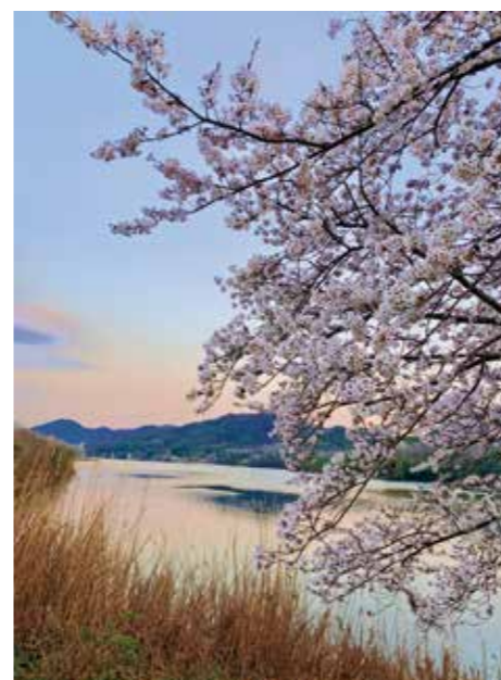
千丈寺湖 = 末 =