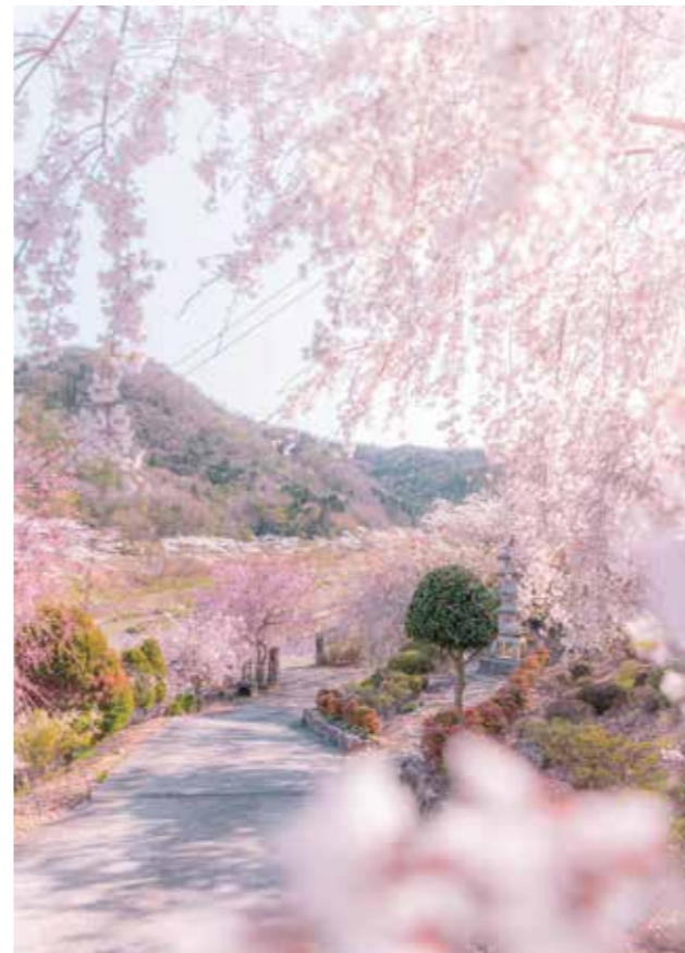
枝垂れ桜園 = 藍本 =

冊子の中央(18-19ページの間)に、人権広報誌「人権さんだ」を挟み込んでいます。抜き取って、ご覧ください。