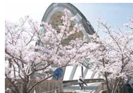
センチュリー大橋 = けやき台 =