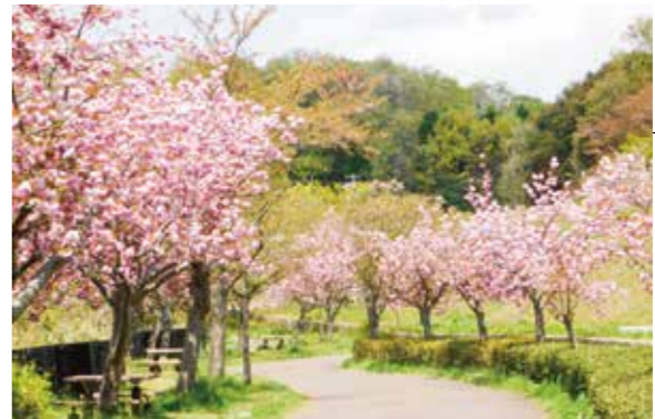
深田公園 = 弥生が丘 =