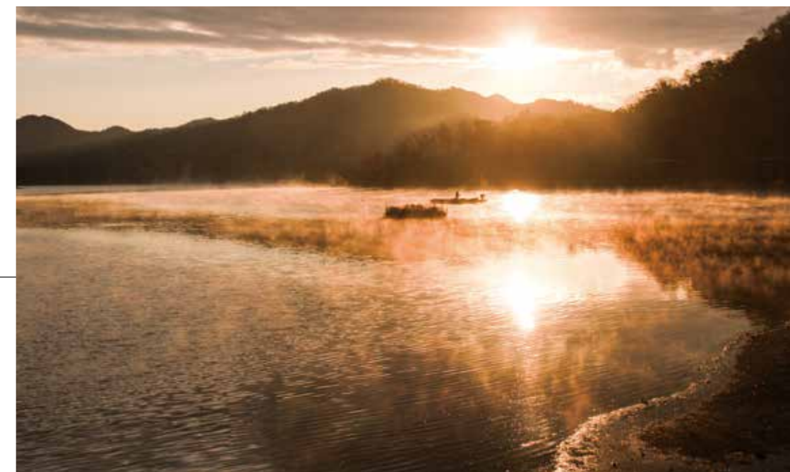
千丈寺湖 = 末 =

ここ三田の日の出から始まる、新しい一年。早朝、寒空のもと待つ——普段何気なく見ている景色が「特別」なものになるかも。皆さんはどこで初日の出を見ますか。