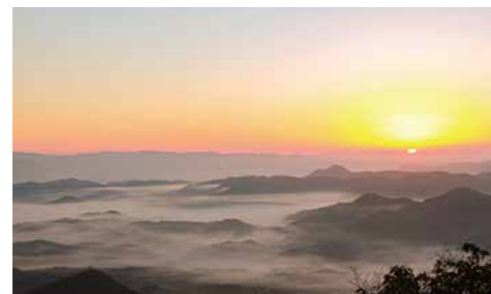
羽束山 = 香下 =

湖上に白く漂う霧、「蒸気霧」。暖かい水面に冷たい空気が流れると、湖面から水蒸気が蒸発して発生します。朝日に照らされキラキラ輝く湖面と合わせり幻想的な景色が楽しめます。