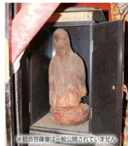
※観音菩薩像は一般公開されていません