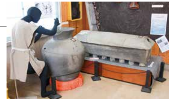
▲須恵器の壺と棺 (三田ふるさと学習館)

末という地名は焼き物の須恵器の「すえ」が由来と言われ、「陶」と表されていました。平安時代に花山法皇が花山院(尼寺)に來られた時、須恵器を献上したことからその名がついたとも言われています。やがて、同音で簡単な「末」の字があてられたと言い伝えられています。実際に、末の各所に窯跡があり、多くの須恵器が出土しています。