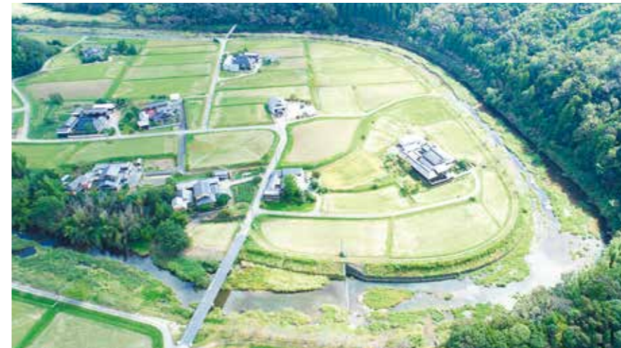
▲手前が上流で、奥に向かって流れる武庫川