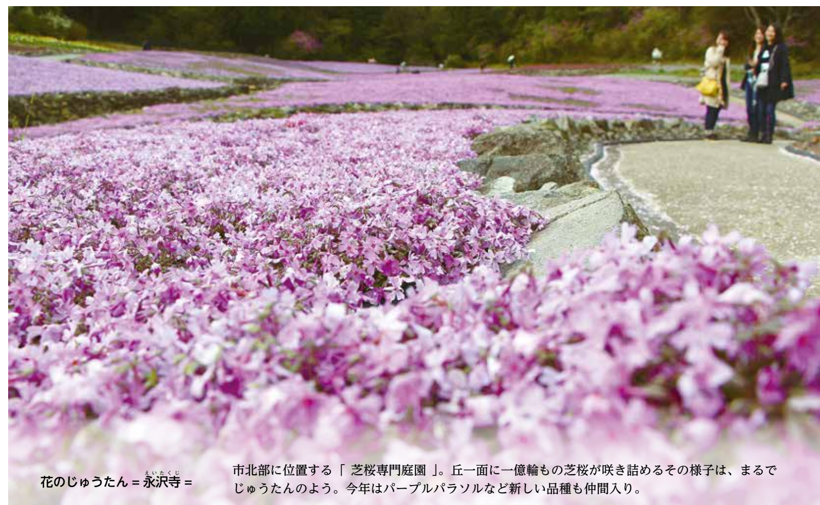
花のじゅうたん = 永沢寺 =

「三田の春」と言えば、皆さんは何を思い浮かべますか？ 三田には数々の桜の名所がありますが、桜だけではありません。 春を彩る花のスポット、ご紹介します。 ※桜スポットは、14・15ページでお知らせしています。