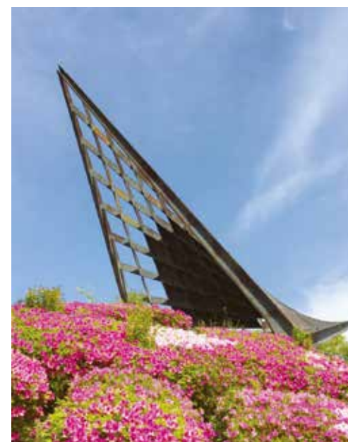
はじかみ池公園 = あかしあ台 =

市北部に位置する「芝桜専門庭園」。丘一面に一億輪もの芝桜が咲き詰めるその様子は、まるでじゅうたんのよう。今年はパープルパラソルなど新しい品種も仲間入り。