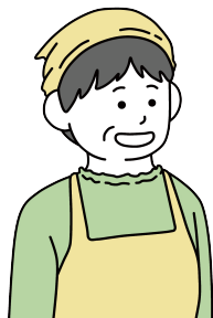
Oさん 経験年数 11年