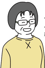
Iさん 経験年数 2年

最初の頃は訪問することに戸惑いもありましたが、何度かお訪ねするうちに、顔を覚えてくださるうちにお話してくださるようになり、それがとても嬉しかったです。その経験から自信を持つことができ、この活動がどんどん好きになりました。