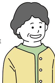
Fさん 経験年数 23年