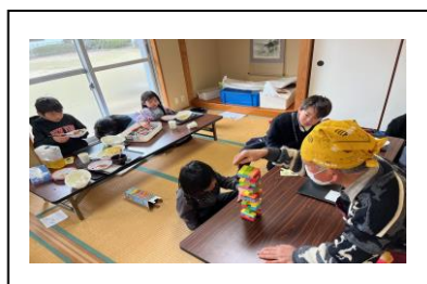
▲子ども地域食堂の様子