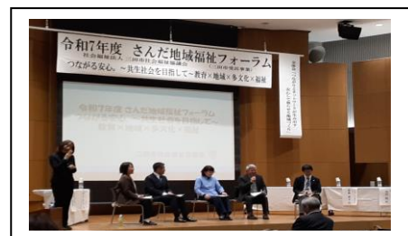
▲フォーラムの様子