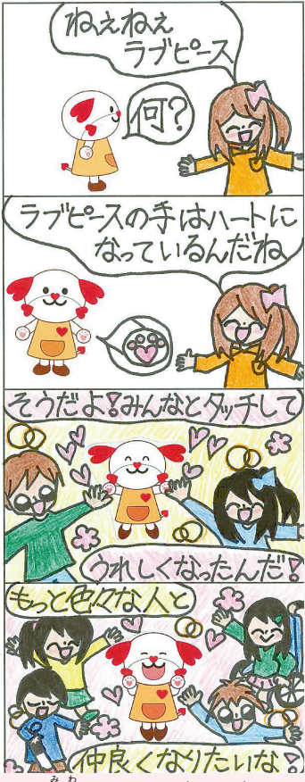
三輪小学校 6年 (前年度)