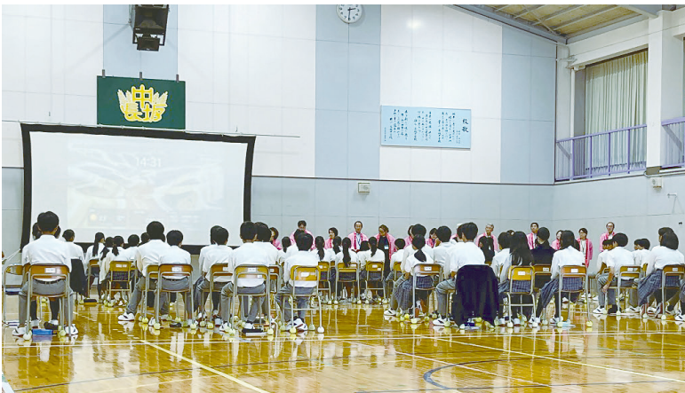
中学生向けの人権教室

人権教室での生徒からの発表では、「優しい言葉かけ」「やわらかい声かけ」が大切だといった私たちが大人がハツとさせられるような発言もありました。これまで経験したことがない優しい気持ちになれる人権教室となりました。