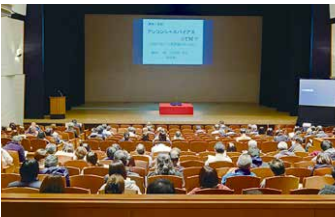
「人権と共生社会を考える市民のつどい」のようす

私たちそれぞれが、自分自身の中にアンコンシャスバイアスがあることを意識したうえで、相手の人権を尊重し、多様性を認め合うようにすることが、誰もが自分らしく生きることが出来る共生社会をつくるための第一歩となるのではないのでしょうか。