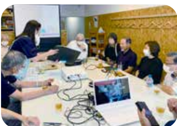
▲失語症カフェのようす

また、「ゆめひろば展」さんだ」と題して絵画や切り絵、写真などの作品展を開催しているほか、交流会も行っています。参加者は「失語症があるから…」という後ろ向きな姿勢から、目標がある生活へと変化し、生活の楽しみを見つけていっています。