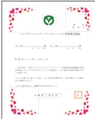
パートナーシップ・ファミリーシップ宣誓書 受領証

社会にはいろいろな個性を持つ人がその個性を活かして生活しています。多様な考え方があればあるほど、選択肢が広がり・深まり、より安心でより快適な暮らしにつながっていくと考えます。年齢・性別・人種・経験・趣味嗜好などの多様な個性をお互いが認め合い、また、場所やシーンによっては誰しも集団の中のマイノリティになる可能性があることを認識するということ、多様性を活かすカギになるのではないのでしょうか。