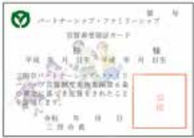
パートナーシップ・ファミリーシップ宣誓書 受領証カード