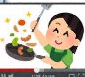
事前調理動画視聴

*実際に台所などで調理をします。お子さんの調理の様子をオンラインに映すなど、保護者のサポートが必要です。