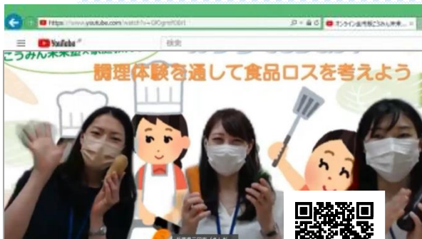
紹介動画視聴二次元コード

「健康増進課の食育講座」と子どもの学びを創造する「こうみん未来塾」、更には保護者の学びをサポートする「家庭教育学級」がタッグを組んで、親子向けに開催する夏休み企画です。一石三鳥ならぬ一石四鳥かも？