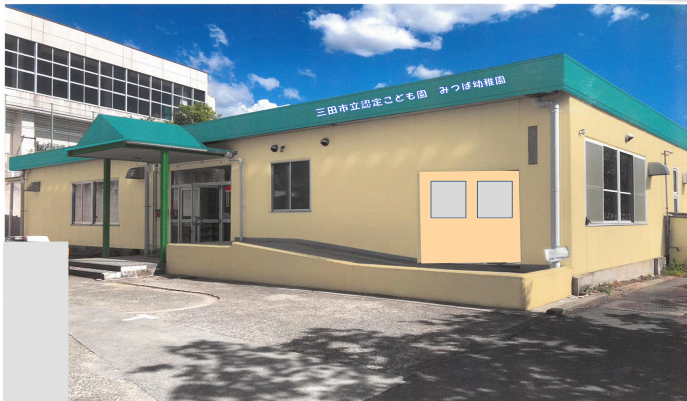
カラーシミュレーション