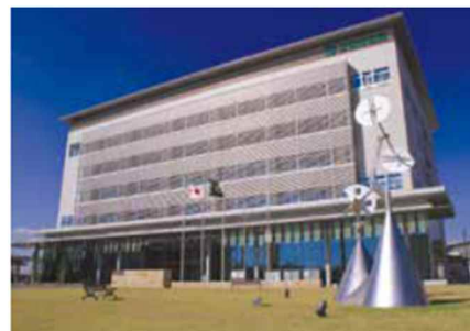
■三田市役所に対する信頼の程度について