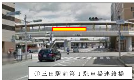
①三田駅前第1駐車場連絡橋