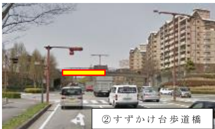
②すずかけ台歩道橋