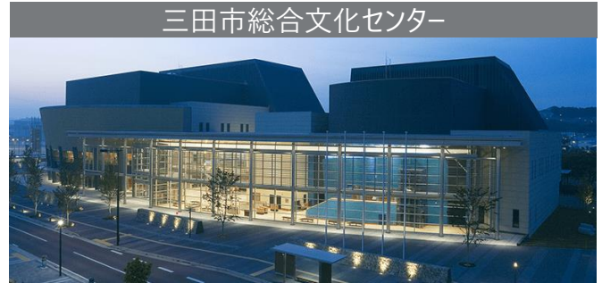
三田市総合文化センター

民間事業者のアイデア・ノウハウを活かした三田市総合文化センターの今後の改修及び運営を検討することを目的として、様々な意見や提案を頂くサウンディング型市場調査を実施します。 事業アイデア・参加意向等について、ぜひ意見交換させていただきたく、ご参加お待ちしております。