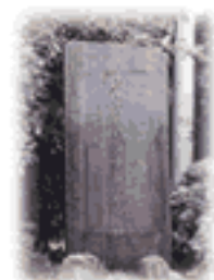
古城浄水場 竣工記念碑

そこで、昭和 11 年 8 月、三田大橋付近に下山取水場を設けて武庫川の伏流水を取水し、ポンプで古城浄水場に汲み上げ、ろ過池で浄化し、給配水する計画を認可申請し、昭和 12 年 1 月 14 日工事施工の認可がおりました。同年 11 月 30 日には第 1 期工事の竣工（計画給水人口 6,000 人、計画 1 日最大給水量 800 立方メートル）、給水開始となったのです。