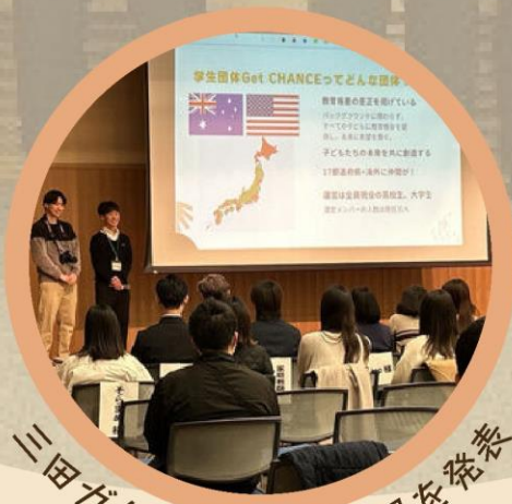
三田ガクチカFESで成果を総括