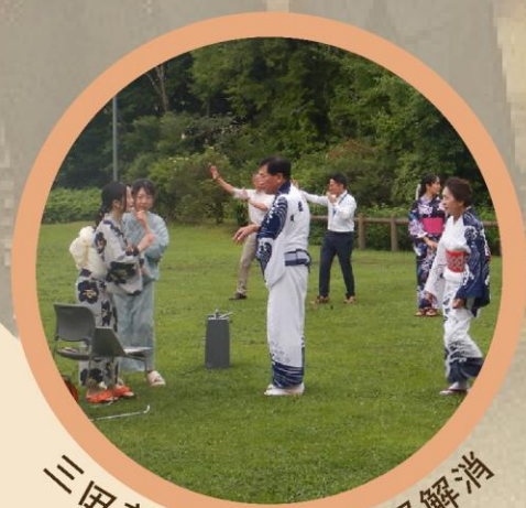
三田音頭の担い手不足解消