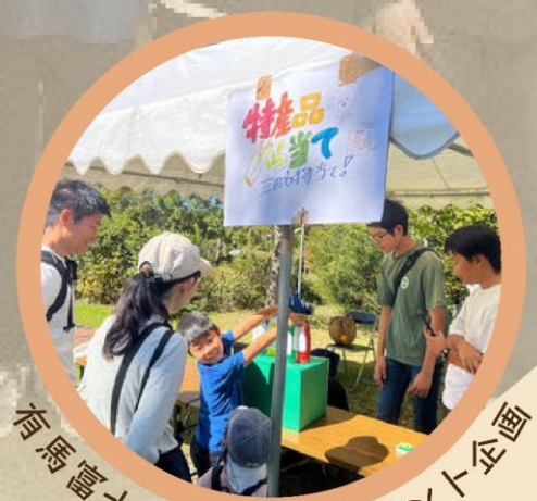
奇馬富士公園で大型イベント企画