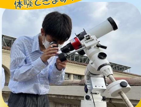
太陽観察の様子 協力：さんだ天文クラブ