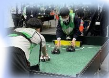
三田祥雲館高校 科学部 Robotics 班