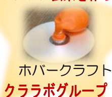
ホバークラフト クララボグループ

望遠鏡をのぞきにおいで！ 窓ぎわに置いた望遠鏡 で地上を観察します。 遠くの景色が近づくこ とを確かめてみましょう。