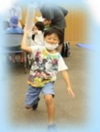
三田祥雲館高校 科学部天文班