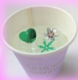
三田アロマテラピー協会

外国人の先生から！ 英語で学べるプログラミング教室 英語もプログラミングも 遊びながらしっかり学べる 仕掛けがいっぱい！ ネッツテラス新三田