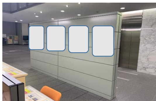
(広告掲載箇所市民課記載台側)