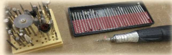
【バードカービングの道具】

バードカービングクラブウッドバードは平成11年に発足しました。平成22年から共生センターの登録グループとして活動しています。現在8名で和気あいあいとバードカービングを楽しんでいます。