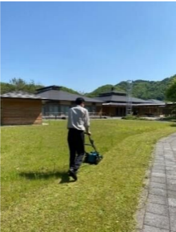
共生センター正門前広場の芝刈りをしました。

市の公共施設を利用するには利用者登録が必要です。利用者登録をすると、利用者登録カードが発行されます。登録するためには、本人確認書類が必要となります。詳しくは、職員にお問い合わせください。