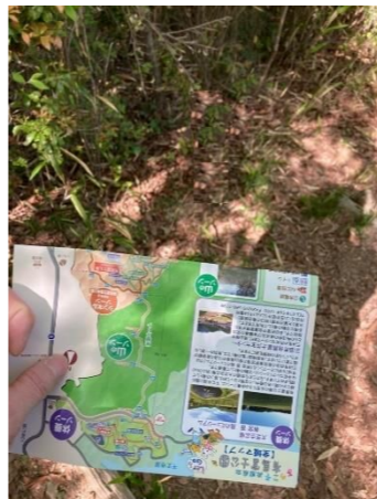
地図を片手に出発!