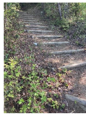
丸太木の階段が続きます。