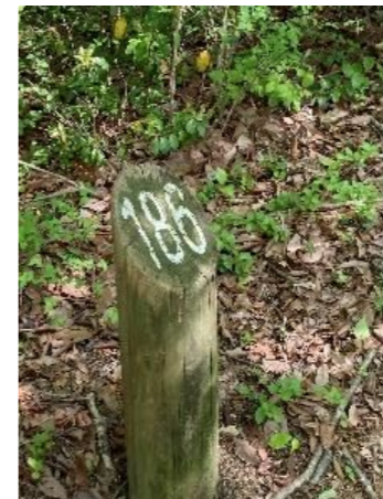
50メートルごとに杭番号があります。