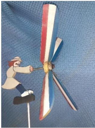
8/20 風見鶏プロペラ型

詳しくは有馬富士共生センターホームページ内“有馬富士共生センター主催講座【木工教室】開催状況”または広報さんだをご覧ください。 申込みを終了している場合や、やむを得ず予定を変更する場合がありますのでご注意ください。