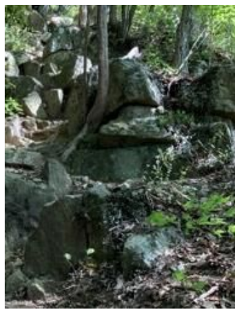
急な岩場を越えて山頂へ!