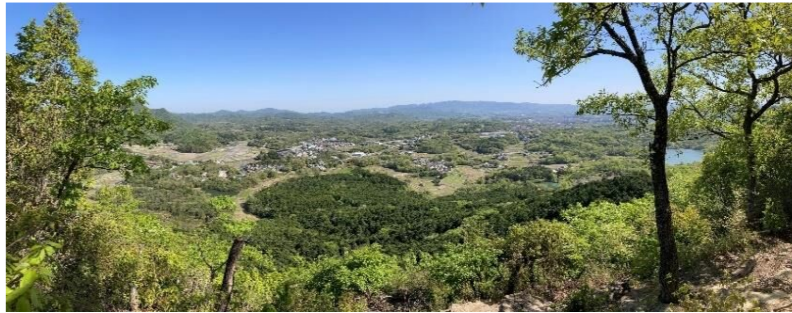
有馬富士山頂からの眺め♪ 風が心地よいです。