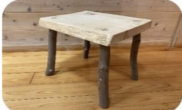
3/17 ワイルドな枝スツール