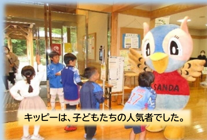
キッピーは、子どもたちの人気者でした。