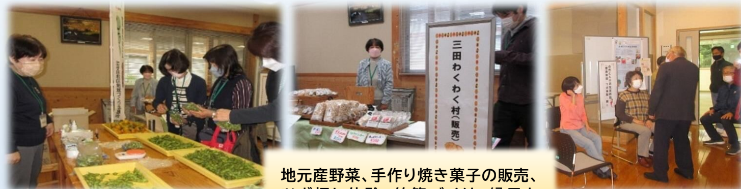
地元産野菜、手作り焼き菓子の販売、ツボ押し体験、竹箸づくり、縁日も大変賑わっていました。