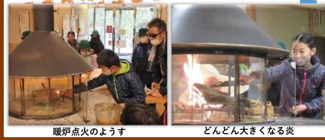
暖炉点火のようす