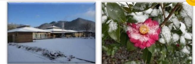
雪化粧した共生センターと山茶花(さざんか)