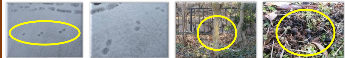
【雪の日に動物が歩いた跡】