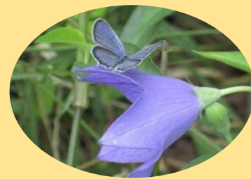
ツバメジジミと キキョウ 6月～10月