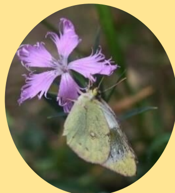
ナadeshikoと モンキチヨウ 春～秋