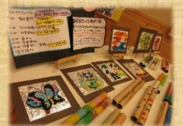
昨年の展示の様子です