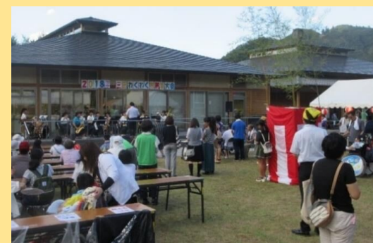
—昨々年のわくわく村夏祭り 共生センターにて