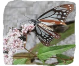
有馬富士共生センターに 飛来したアサギマダラ