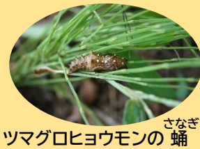
ツマグロヒヨウモンの さなぎ 蛹