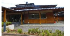
有馬富士共生センター 人と自然の共生や 市民の交流施設として 開設されました。 ロビーには暖炉があり、 冬場には薪を入れます。