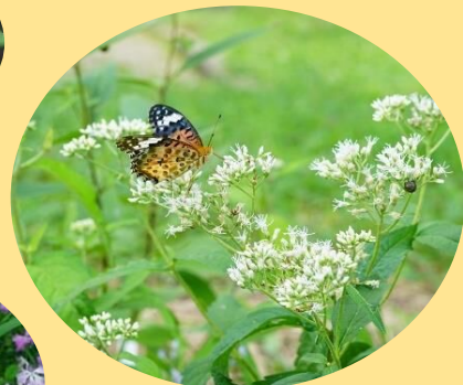
ツマグロヒヨウモンと ヒヨドリバナ 8月～10月