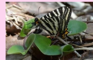
ヒメカンアオイに卵を産んでいるギフチョウ