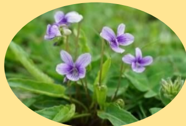
アリアケスミレ 4月上旬～5月