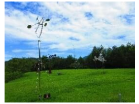
風のミュージアム 彫刻家 新宮晋さんの 風で動く彫刻が展示 されています。