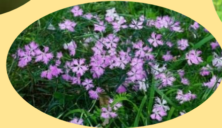
カワラナデシコ 7月～10月 秋の七草