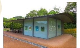
風の庵 (休憩施設) 建物内のご利用は、 土日祝の10時から 16時まで。