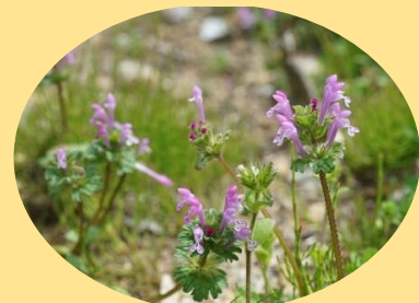
ホトケノザ 3月～6月 春の七草