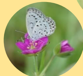
ヤマトジジミと ゲンノショウコ 7月～10月