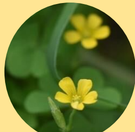
カタバミ 5月～10月 葉はハート型