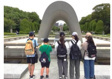
【平和への祈り、不戦の誓い】