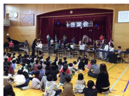
6年「カルメン」 ～前奏曲、アレグロネズ、闘牛士～