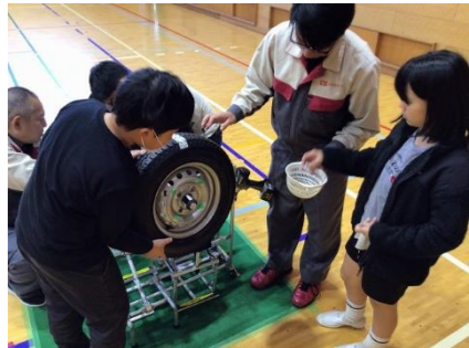
タイヤの取り付け体験