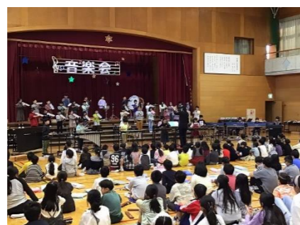
2年「スーパ-カリフラジ リスティック エキスピアリト-ジャス」