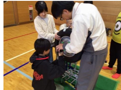
タイヤの取り付け体験