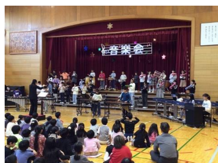
4年「マツケンサンバⅡ」