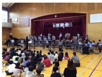
5年「パレ-ツォ カビアン」 ～メダリオン・コールズ、彼こそが海賊～