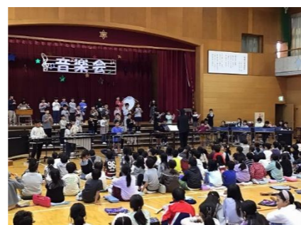
3年「ラデツキー行進曲」