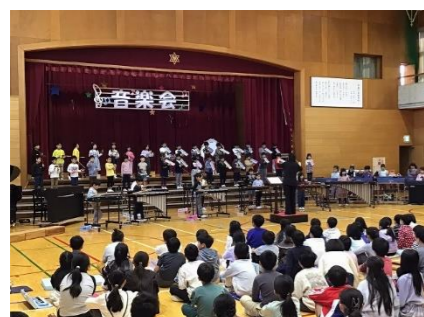
1年「わらの中の七面鳥」