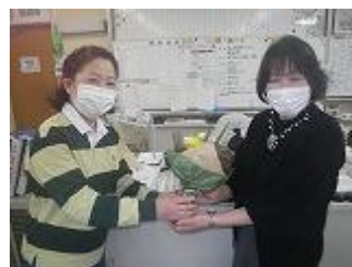
☆プレゼンターは、たくさんの感謝の気持ちを述べていました。