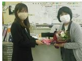
☆素晴らしい功績を残され、思い出いっぱいの先生方、ありがとうございました。