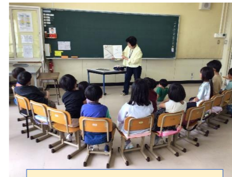
2年生アリスの会読み聞かせ