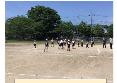
にこにこデー(縦割り活動)