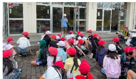
全校生でかけ声をかけて出発!