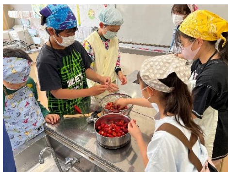
三田いちごでジャム作り

本校は、『問いをつなぎ主体的に学ぶ子どもを目指して』というテーマで今年度も社会科学習と食育の研究を継続します。①地域の特色を活かした教材開発、②教科書の効果的活用、③ICT機器の活用④子どもたち同士の学び合いの環境づくりに等に取り組めます。保護者の皆様や地域の皆様にインタビューや体験学習などでご協力をお願いすることもあります。今年度はPTA会費からも子どもたちの食育に各学年予算をつけていただいています。各学年の取り組みは、食育だよりでも紹介していきます。