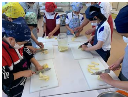
旬の食材でタケノコ料理