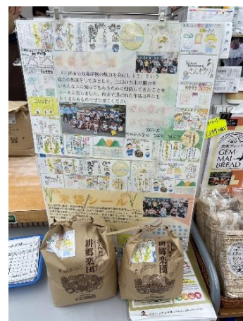
松小オリジナル米袋販売