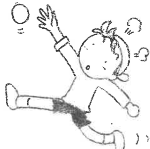
適度に運動をしよう