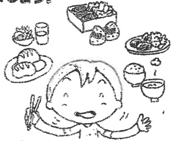
食事は1日3食バランスよく