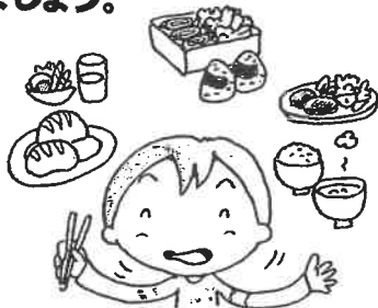
食事は1日3食バランスよく