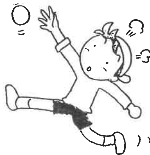
適度に運動をしよう