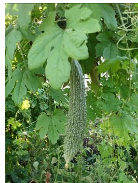
【学校園のゴーヤも最盛期】