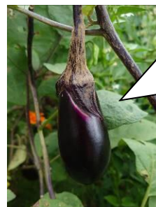
【これから旬の秋ナス】