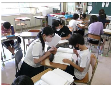
【高校生と勉強頑張っています】