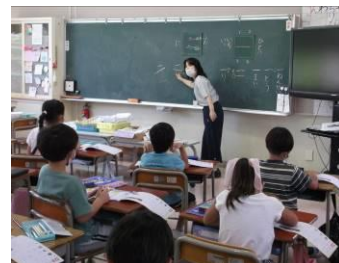
【初めての漢字「一」「二」】

3つめは季節の移り変わりに目を向けることです。暑い夏でしたが、ここ数日の秋の気配が感じられる写真を見せました。稲の実り、ここ数日に咲いた草花、草むらでつけた虫たちの写真です。また、セミの声が変わってきたこと、コオロギやキリギリスの声が大きくなってきたことなど、見たり、聞いたりして気付けることを紹介しました。そのほか、朝夕の風のさわやかさや食べておいしい野菜の種類、少し早いけれども稲の香りやキンモクセイの香りが感じられることなど、目や耳だけではなく、鼻や口、肌で感じられる秋も紹介しました。