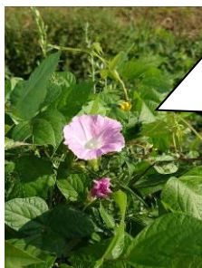
【のんびり屋の朝顔】