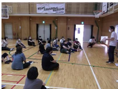
【先生たちも研修しています】