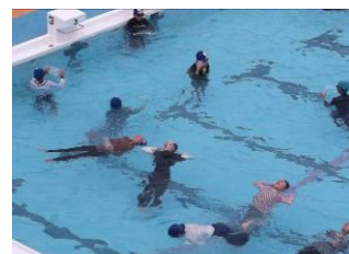
【命を守る着衣泳の学習】

明日からは夏休みで、家庭や地域で過ごすことが多くなります。コロナ第7波の到来が報道されていますが、休み明けには修学旅行を予定しております。引き続き、感染防止対策の徹底についてご家庭でのご協力をよろしくお願いいたします。また、夏休みは普段と異なる体験ができるチャンスでもあります。ぜひ「優しい心」で多くの体験を重ね、元気で2学期に登校してくれること