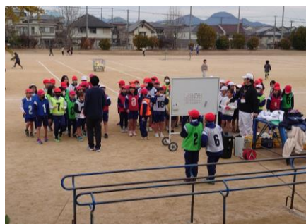
【開会式の様子。この後、大盛況】