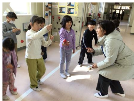
【ボランティアさん大活躍でした】

1月17日(水)には、1.17の集いと避難訓練、防災学習を実施しました。全校で黙とうした後、各クラスで地震や命の大切さ、人とのつながりの大切さ、防災の考え方等について学びました。避難訓練は掃除の時間に地震が起きたという想定でした。放送を聞き、通れない場所を確認してから、指示に従って避難しました。授業中と異なり、担任の先生がいない中での避難でしたが、一生懸命取り組みました。