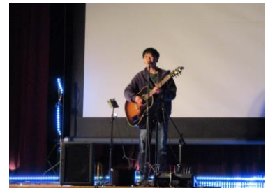
【感動的なコンサート】