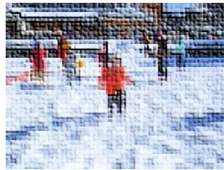
休み時間には一緒に遊びます