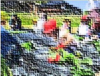
サツマイモの苗植え

また地域の方からお借りしている「ふれあい農園」で、様々な野菜の栽培し、生長の不思議さや収穫の喜びなど様々な感受性を豊かに育てています。今年はキュウリやサンド豆が大豊作でした。また昨年収穫した黒豆を使った味噌も熟成して出来上がり大成功でした。自分で植え育てた収穫物がおいしい食材になるという嬉しい経験をする事ができました。