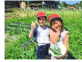
キュウリを毎日収穫