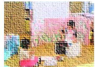
海の見えるカフェ