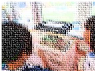
身近な生き物を飼育しました