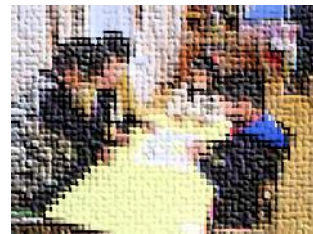
地域の方々との交流