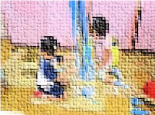
家ごっこ(シャワーづくり)

安心すると、身近な環境に興味関心を示して、動き始めそして遊び始めます。一人ひとりの興味を大切に、それに寄り添いながら遊びを展開していきました。身近な環境の様々なものとの出会いの中で感じたり、考えたり・・・心の引き出しにたくさんものを溜めこんでいきます。体験して得たものや経験を積み重ねてやがて生きる力を養っていくことができるように、心を揺さぶる体験活動を多く取り入れていきました。