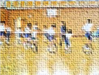
小学生さんに支えられて一輪車

様々な行事や活動を共にしている小学校。児童園児は互いに積極的に関わり普段から深いつながりをもっています。小学生から優しく関わってもらった経験は、園児の心に心地よさや喜びとして溜め込まれていきます。また小学校の先生に日頃から声をかけてもらったり頑張りを認めてもらったりすることは安心感や自信となり、また進学する時の幼稚園から小学校へのスムーズな移行にもつながっていきます。