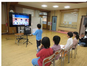
鳥羽市神島小学校と オンライン交流