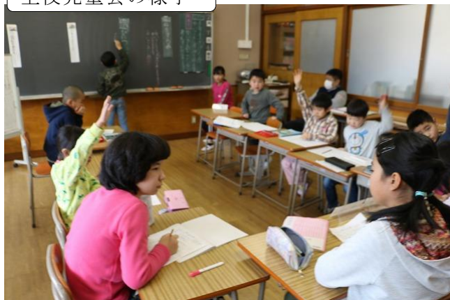
全校児童会の様子

2月7日に全校児童会がありました。今回は、初めて4年生が司会団として加わりました。事前にどのようなめあてや小柱で話し合うか5年生と中学年で相談をしました。合わせて中学年は、5年生から進め方の手ほどきを丁寧に教えてもらい話し合いに臨みました。