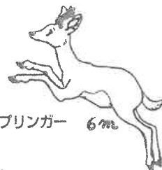
クリップスプリンガー 6m