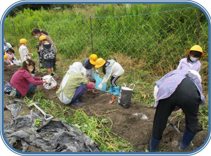
10月5日「サツマイモ掘り」 幼・1年生 サツマイモを掘りに行きました。たくさん獲れました。