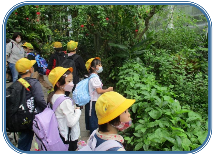
10月7日「校外学習②」 1・2年生 きれいなアゲハチョウが、たくさん室内に飛んでいました。