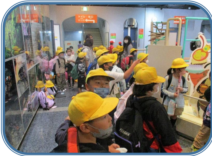
10月7日「校外学習」 1・2年生 昆虫館に行きました。たくさんの昆虫に出会いました。