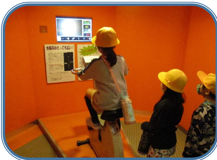
10月7日「校外学習③」 1・2年生 こども文化科学館では、宇宙や星について体験しました。