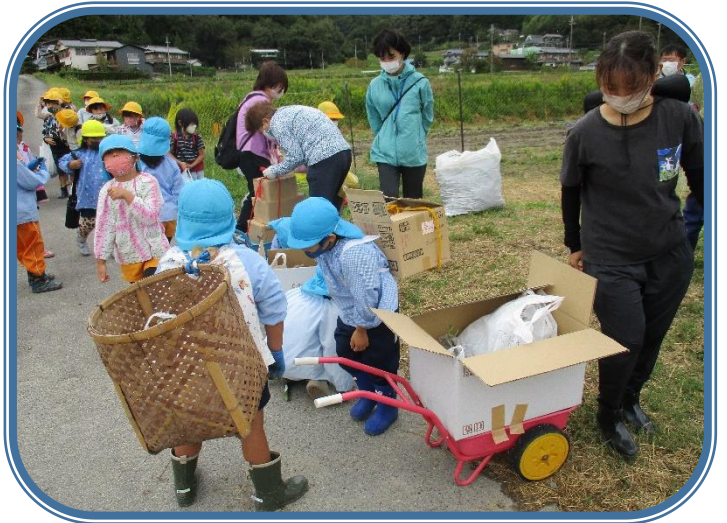
10月5日「サツマイモ掘り」 幼・1年生 いっぱいのサツマイモ、学校まで持って帰るのにひと苦勞です。