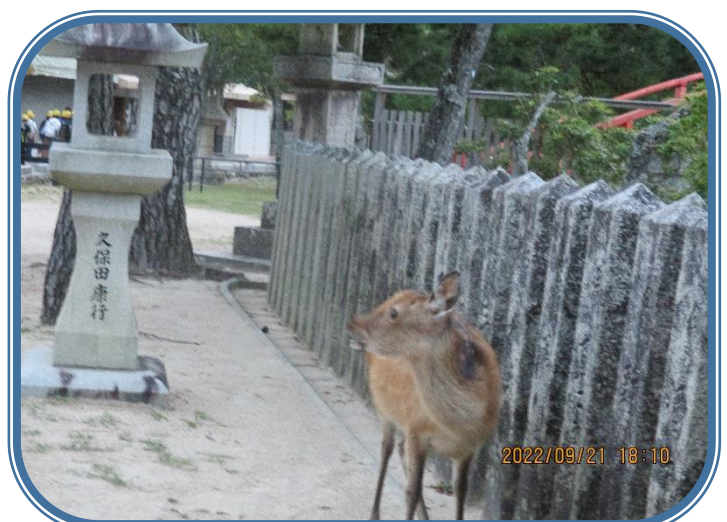
「大鳥居」 宮島 大鳥居の工事は、70年に一度の改修工事だそうです。